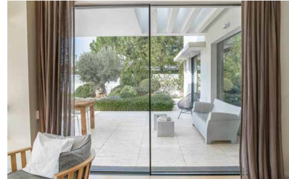
Schüco ASE 36 PD Schüco ASE 36 PD